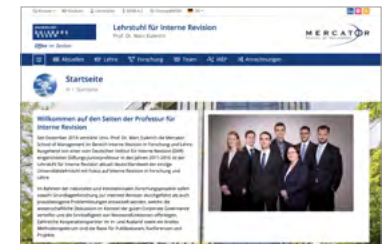
Webseite des Lehrstuhls für Interne Revision.

Der Lehrstuhl Interne Revision an der Mercator School of Management ist aktuell deutschlandweit der einzige Universitätslehrstuhl mit Fokus auf Interne Revision in Forschung