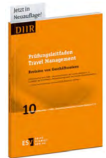
Band 10 der DIIR-Schriftenreihe: Prüfungsleitfaden Travel Management ➔

Unabhängig von Größe, betrieblichem Reisevolumen oder eingesetzter IT, ob im öffentlichen oder privaten Sektor: Der modulare Aufbau des Leitfadens unterstützt Sie bei der Erstellung passgenauer Prüfungskonzepte und Checklisten für die spezifischen Anforderungen Ihrer Organisation.