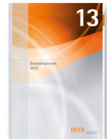
Der DIIR-Geschäftsbericht 2013

..... Mitte August 2014 hat das DIIR den Geschäftsbericht für 2013 veröffentlicht. Der umfangreiche Bericht gibt einen Überblick über die vielfältigen Aktivitäten des Instituts. Der Bericht ist auf der Homepage des DIIR unter diesem Link ▶ verfügbar. Druckexemplare können Sie unter info@diir.de anfordern.