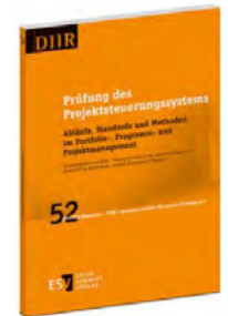
Band 52 der DIIR-Schriftenreihe: Prüfung des Projektsteuerungs- systems

Band 52 wurde vom AK Projekt Management Revision verfasst. Das Buch „Prüfung des Projektsteuerungssystems“ behandelt professionelle Methoden für das Management mehrerer Projekte, also von Portfolios und Programmen. Welche Projekte benötigt werden, wie sie priorisiert, beaufsichtigt und gesteuert werden, ist Aufgabe des Projektsteuerungssystems. Oft ist die Qualität des Projektsteuerungssystems entscheidend dafür, ob Projekte ihre Ziele erreichen. Daher kommt dessen Prüfung entsprechend hohe Bedeutung zu.