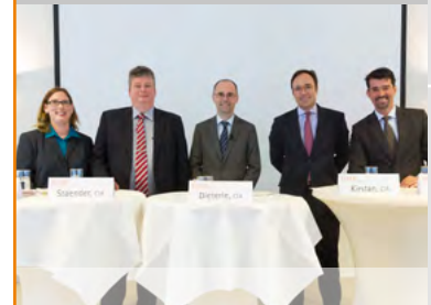
Teilnehmer der Podiumsdiskussion bei der QA-Tagung

Abschließend wurde im Rahmen einer Podiumsdiskussion mit Mitgliedern der Projektgruppe QA Fragen rund um die Anwendung des QA-Leitfadens und Erfahrungen aus durchgeführten Assessments sowie die neuen Anforderungen an die Akkreditierung der Quality Assessoren behandelt.