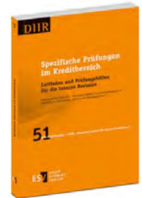
Band 51 der DIIR-Schriftenreihe: Spezifische Prüfungen im Kredit- bereich